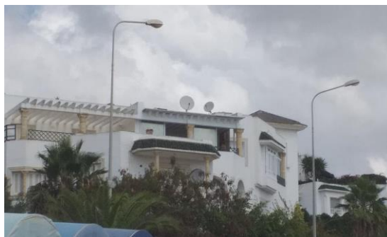
Fig 12. Résidence les Cascades Ennasr II