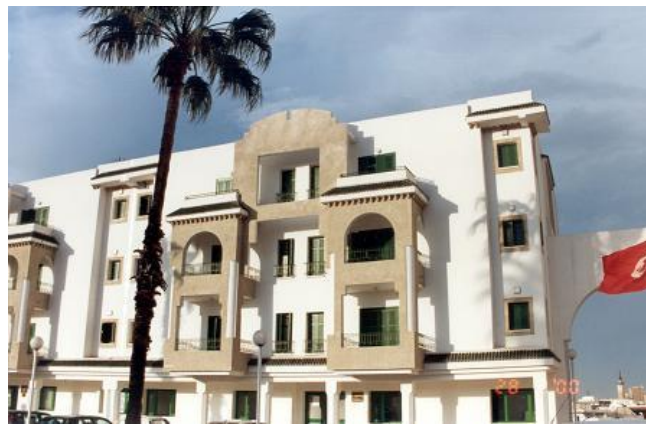
Fig 6. Immeuble "Bab Saadoun" SNIT 1995 Avenue 9avril Tunis (snit.tn)

La SNIT instaure un langage reproduisant et interprétant des éléments architectoniques du style arabisant. Exemples : l'ouverture avec moucharabieh dite "Guenaria" qui s'allonge sur deux niveaux, les arcades qui accentuent la verticalité de la façade (Fig6.), la recomposition avec les dents de scies, les moucharabiés et les voûtes croisées (Fig7)