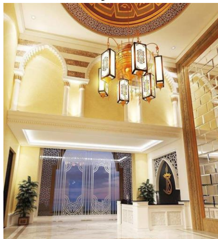
Fig 10. Décoration riche à l'intérieur d'un duplexe haut standing. Résidence Tej El Molk Ennasr II

A la recherche de distinction face à la concurrence, les promoteurs immobiliers privés ouvrent la référence à l'architecture arabo-musulmane en dehors de la médina telle que ; la référence à Sidi Bou Said avec l'usage de la couleur et des ouvertures typiques de sidi Bou Said (Fig 11) ou la référence au toit marocain (Fig12) et aux arabesques du djeliz marocain (Fig13).