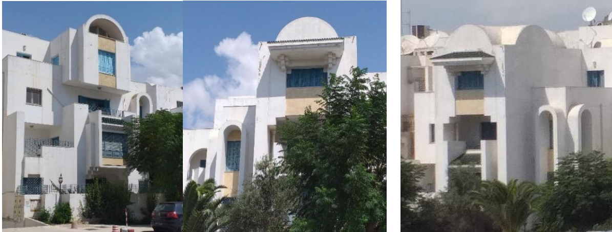
Fig 7. Résidence "Ennakhil" El Manar II au nord de Tunis, SNIT