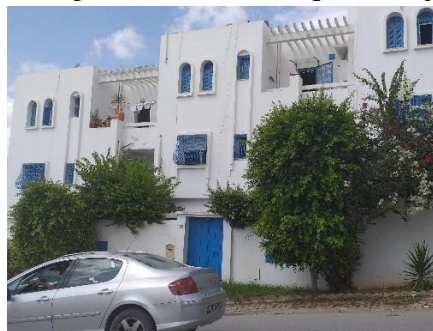
Fig 11. Résidence Parc City Ennasr II

A la recherche de distinction face à la concurrence, les promoteurs immobiliers privés ouvrent la référence à l'architecture arabo-musulmane en dehors de la médina telle que ; la référence à Sidi Bou Said avec l'usage de la couleur et des ouvertures typiques de sidi Bou Said (Fig 11) ou la référence au toit marocain (Fig12) et aux arabesques du djeliz marocain (Fig13).