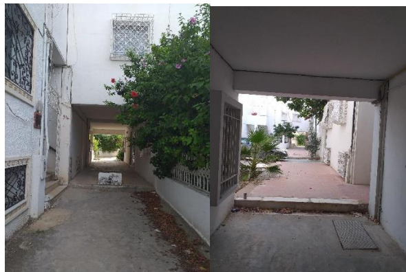
Fig 15. Patio et Sabbat dans le projet résidentiel les UV4, SNIT.

Le deuxième projet urbain étudié est le quartier résidentiel les UV4 à Menzah 6 au nord de la capitale. Ce projet organise un ensemble de logements semi-collectifs autour de patios, de passages piétons et des sabbats. (Fig15)