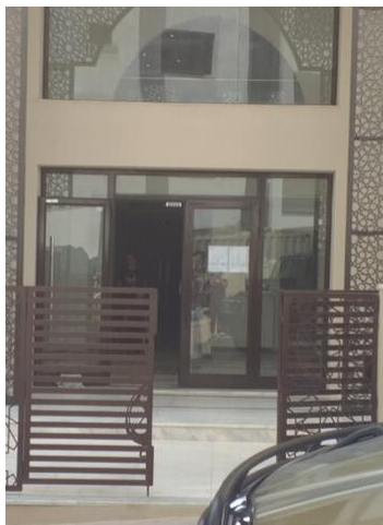
Fig 13. Résidence Tej El Molk Ennasr II

La référence médinale résulte d'un raisonnement par analogie comme celui réalisé par l'architecte Jean Nouvel à l'Institut du monde arabe à Paris. Cette référence se limitant à l'aspect esthétique touche uniquement la dimension formelle de la réinterprétation. Une forme de "habillement" qui met en valeur le projet architectural pour des fins uniquement commerciales.