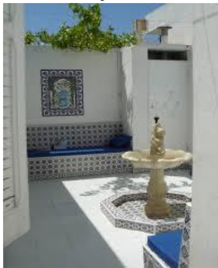
Fig 17. Exemple d'aménagement d'intérieur avec référence à la médina