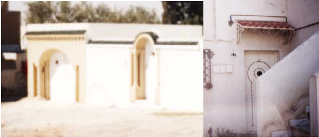
Fig 16. Exemples de façades transformées avec des références à l'architecture de la médina