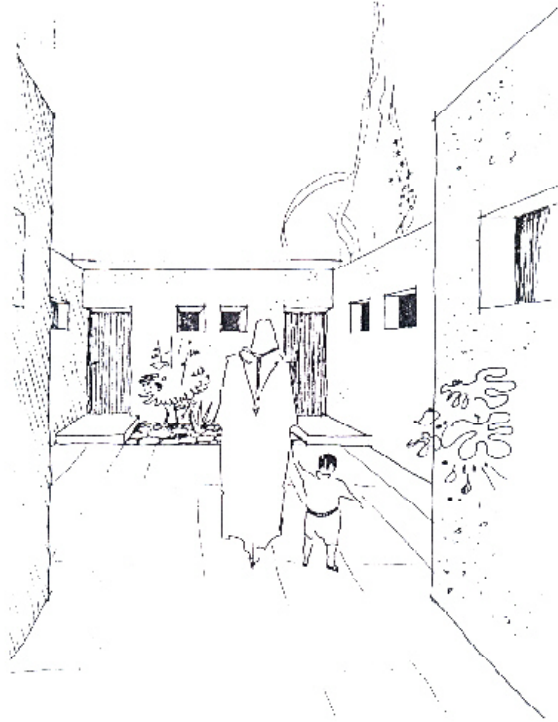
Fig14. Croquis de la cité mettant en scène des personnages portant des habits traditionnels Etude de projet de la cité "Ibn Khaldoun" 5000 logements à Tunis, Catalogue de prototype des habitations à la cité "Ibn Khaldoun" S.N.I.T.

Ce souci de l'intégration sociale est confirmé dans les croquis du projet où les habitants sont habillés en habits traditionnels devant les maisons à typologie médinale. (Fig 14)