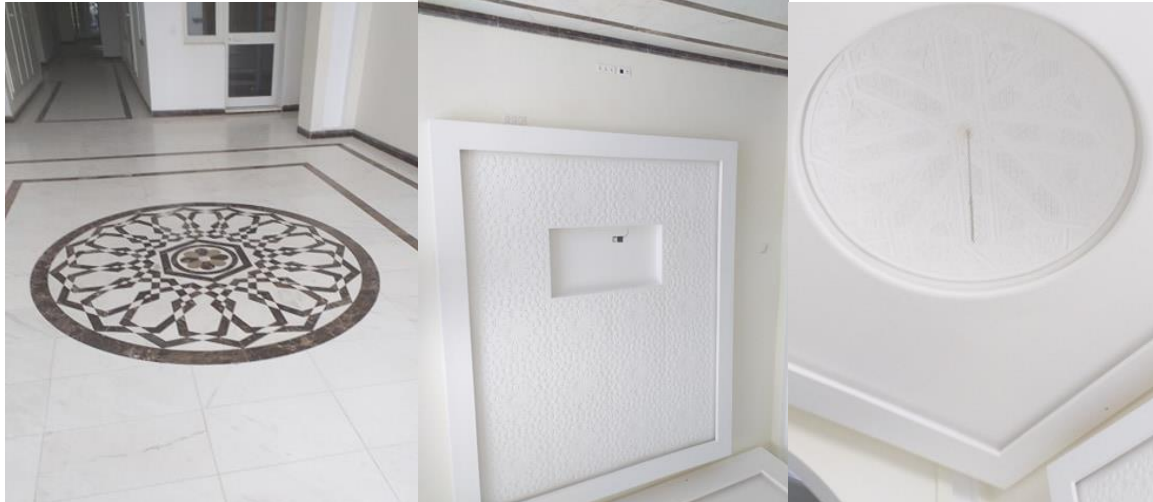
Fig 9. Plâtre ciselé et arabesque au sol, Hall d'entrée Résidence Tej El Molk Ennasr II