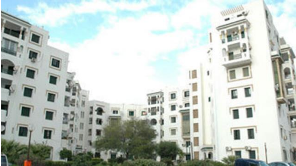
Fig 5. Projet résidentiel Carrefour, SNIT 1992

La SNIT instaure un langage reproduisant et interprétant des éléments architectoniques du style arabisant. Exemples : l'ouverture avec moucharabieh dite "Guenaria" qui s'allonge sur deux niveaux, les arcades qui accentuent la verticalité de la façade (Fig6.), la recomposition avec les dents de scies, les moucharabiés et les voûtes croisées (Fig7)