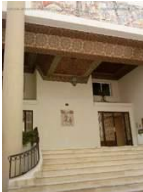
Fig8. Résidence Les Fatimides Ain Zaghouan, Décoration de l'entrée de la résidence